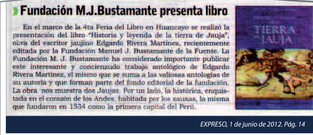
EXPRESO, 1 de junio de 2012. Pág. 14