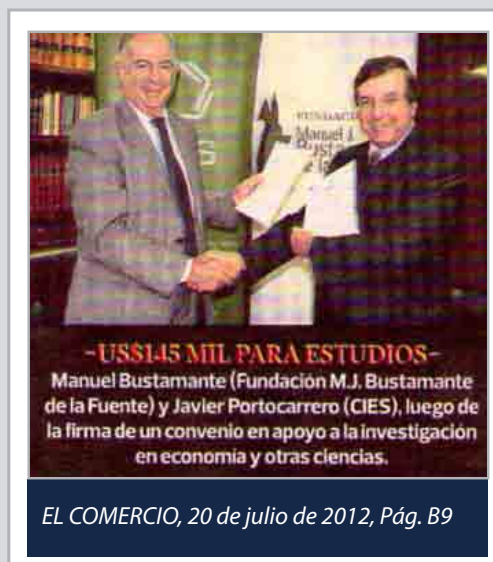
EL COMERCIO, 20 de julio de 2012, Pág. B9