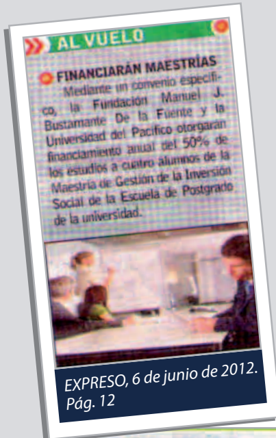
EXPRESO, 6 de junio de 2012. Pág. 12