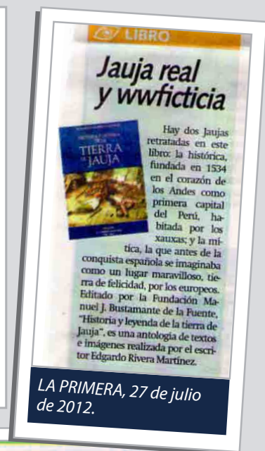
LA PRIMERA, 27 de julio de 2012.